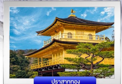
ปราสาททอง